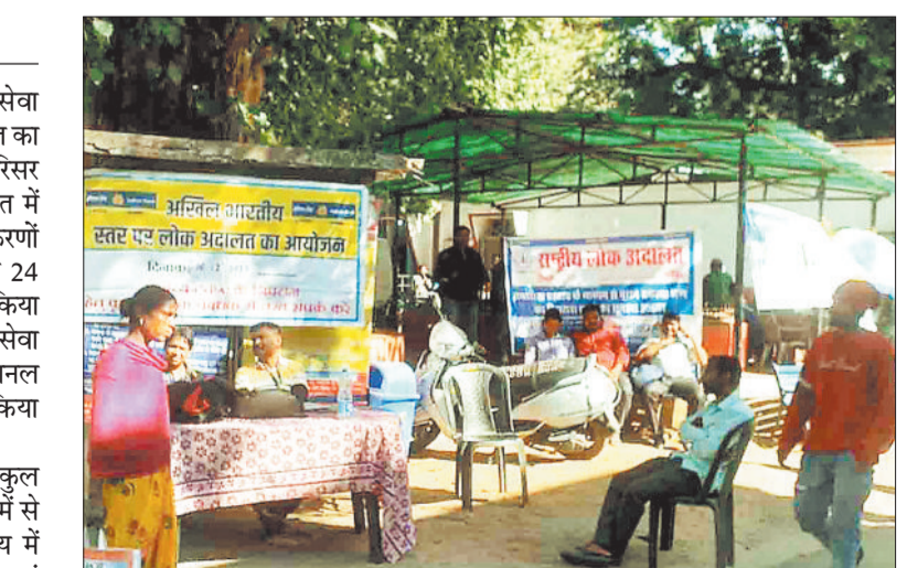
(व्यवहार न्यायालय) में लंबित शमनीय अपराध के प्रकरण मोटर दुर्घटना तथा से संबंधित प्रकरण, धारा 138 एनआई एक्ट के अंतर्गत चेक बाउंस प्रकरण, धारा 125