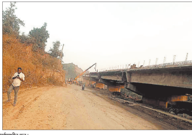
लुचकी घाट का निर्माणाधीन पुल।